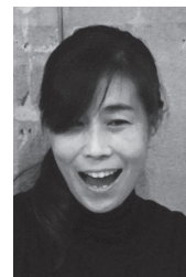
Sasa/Marie (サインミュージック/ ろうナビゲーター)