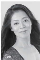
清水理恵 (ソプラノ)